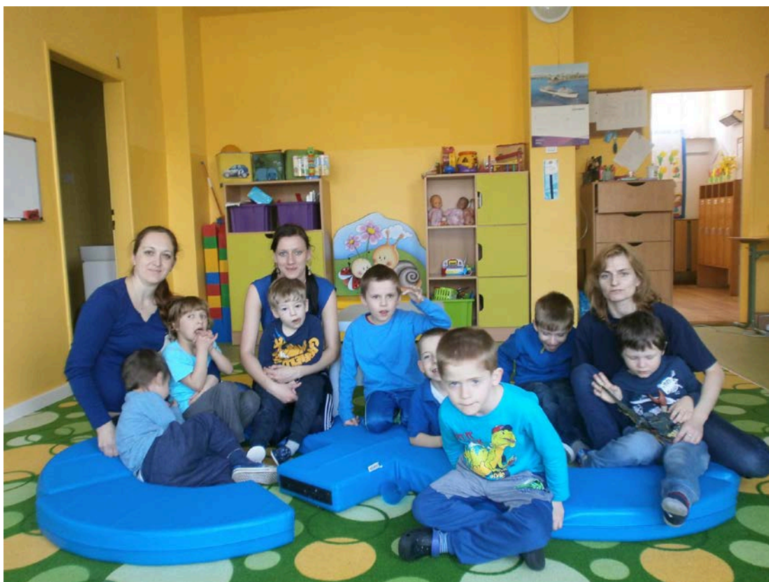
1. MIESTO pre fotku zo Spojenej školy v Dolnom Kubíne (169 páčikov)